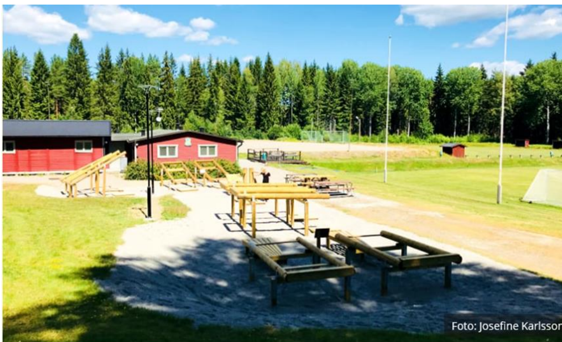
Foto 8 visar exempel på en aktivitetspark/ utegym med varierad utrustning

Katrineholms kommuns hemsida ska hållas uppdaterad med aktuell information om de aktivitetsparker som allmänheten har tillgång till samt hänvisa till Naturkartan där lekparker, aktivitetsparker och platser för upplevelser finns.