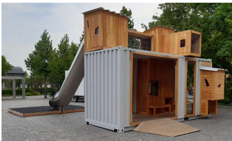
Foto 3 visar den tillfälliga lekparken på Stortorget sommaren 2020 och är ett exempel på en kompletterande lekpark

komplettera det totala lekutbudet i kommunen. Lekparken i sig är sällan anledningen till att invånare besöker platsen men lekparken stärker platsens innehåll. Stortorget, Stadsparken och kommunala badplatser är exempel på detta