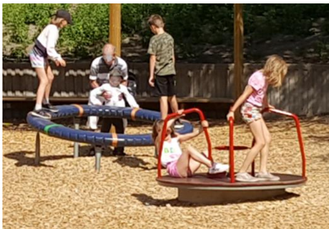
Foto 2 visar exempel på en lekpark med stimulerande och utmanande lekutrustning, bedömt högt lekvärde