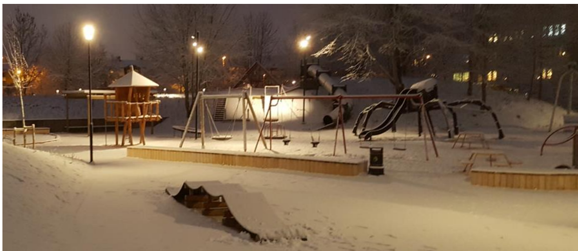
Foto 7 visar en lekpark under vinter och illustrerar vikten av god belysning omkring lekmiljöer

Ljussättning av lekområden tillför estetiska mervärden, ger en ökad känsla av trygghet och kan på den mörkare tiden förlänga den möjliga lektiden. Se även Katrineholms ljusplan.