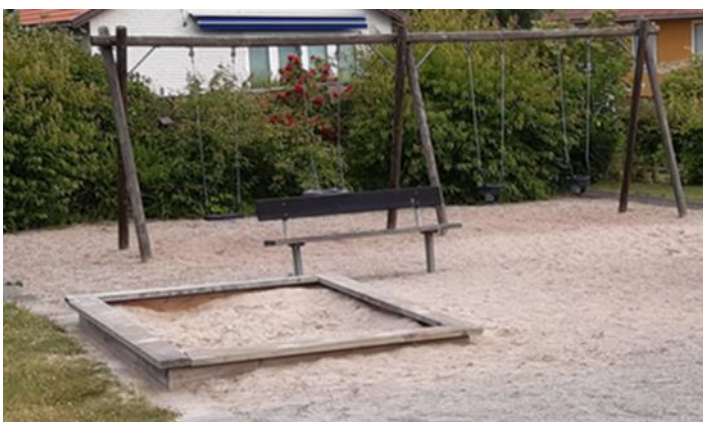
Foto 1 visar exempel på en närlekpark med relativt lågt lekvärde, en innesluten lektyta begränsad till gungställning och sandlåda

Närlekparkerna är i regel begränsade i storlek och innehåll samt är ett besöksmål främst för närliggande bostäder. Dessa platser kan ibland ses som "privata" då de ofta ligger inneslutna med villor runt om. De befintliga närlekparkerna är ofta svåra att hitta till för de som bor några kvarter bort till och tillgodoser i stort enbart de närmast boende. Vid tillskapande av nya närlekparker ska utformningen tillgodose grundläggande lekbehov (gungor, sandlek, rutchkana) men gärna också ytterligare stimulerande utrustning. Placeringen av lekparken ska vara där invånare rör sig och platsen får gärna kombineras med grillplats, sittplatser och ta tillvara på omgivningarnas kvaliteter, ex skog och natur.