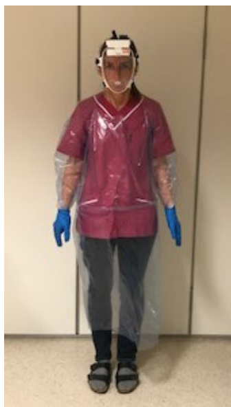
Bild 6: Personlig skyddsutrustning vid vårdnära kontakt med brukare/patient med symtom på covid-19 eller bekräftad covid-19.

Exempel: Arbetskläder, andningsmask TIKI, vätskeavvisande långärmad skyddsrock och nitrilhandskar.