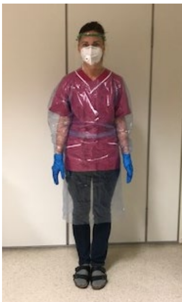
Bild 5: Personlig skyddsutrustning vid vårdnära kontakt med brukare/patient med symtom på covid-19 eller bekräftad covid-19.

Exempel: Arbetskläder, ansiktsvisir, andningskydd KN95, vätskeavvisande långärmad skyddsrock och nitrilhandskar.