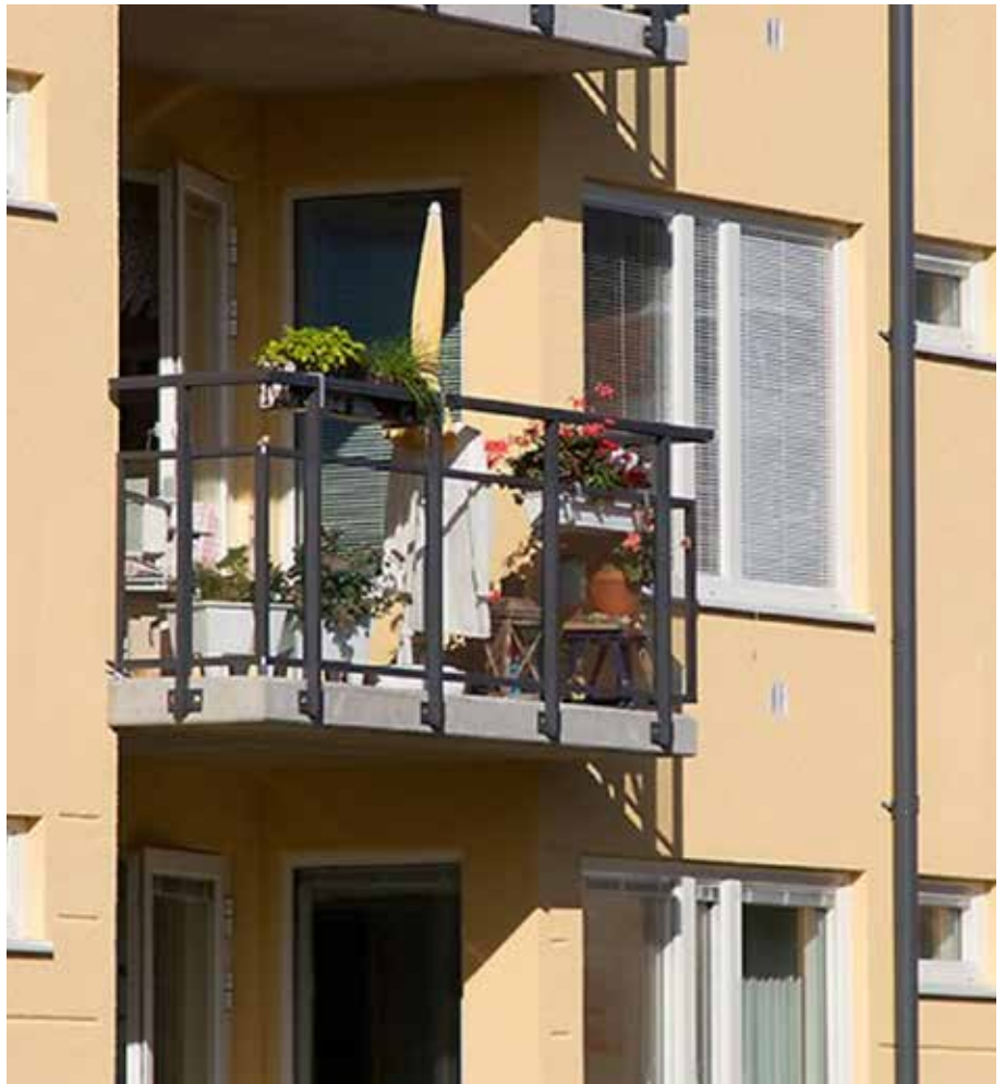
Befolkningsökningen detta år beror främst på inflyttning. Bostadsbyggandet har under en längre tid i Katrineholm, haft full fart.

2015 var året då Katrineholms kommuns slog befolkningsrekord och blev fler än någonsin. Sedan dess har befolkningen stadigt ökat.